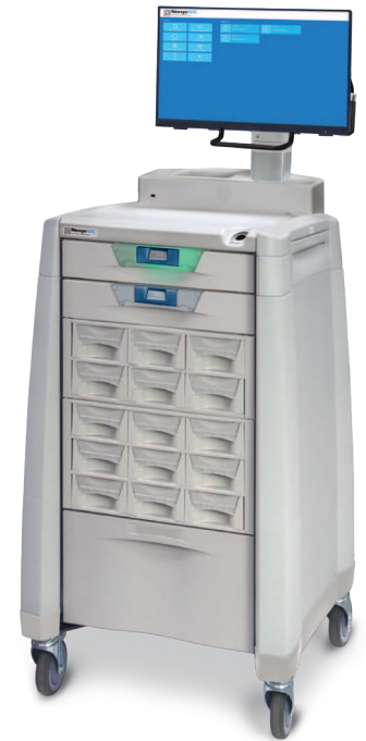
Getoond: 2 CAM's, medicijnbakken, toevoerlade, zwenkwieien