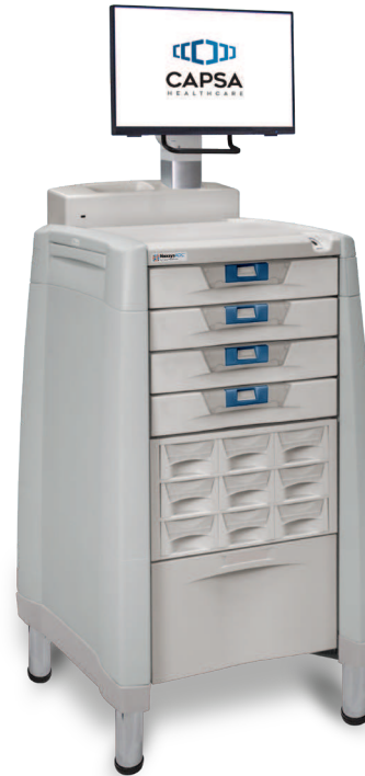
Getoond: 4 CAM's, medicatiebakken, toevoerlade, vaste kaststandaard

NexsysADC biedt een volledig configureerbaar platform voor unieke beveiligings- en opslagcapaciteit voor een scala aan toepassingen en omgevingen in de gezondheidszorg. Raadpleeg Capsa Healthcare over uw specifieke behoeften. U kunt op ons vertrouwen voor het ontwerpen van de configuratie die u nodig hebt.